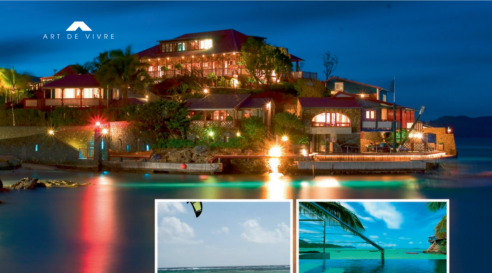
L'Eden Rock, hôtel de luxe, situé sur un promontoire rocheux.