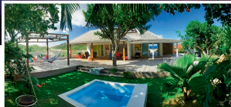
La villa Polaroid sur les hauteurs de Saint-Jean.