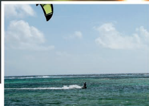
Le lieu idéal pour s'adonner au wakeboard.