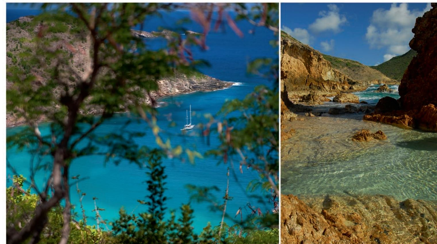
Saint-Barth, petit bijou de paradis.