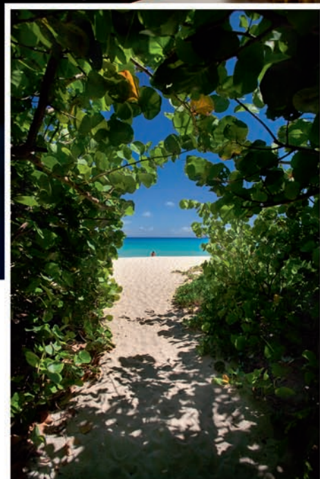
L'une des 17 plages paradisiaques de l'île.